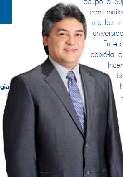
Florentino Cardoso Presidente da Associação Médica Brasileira

Incentivaremos a área científica, a defesa profissional, a boa relação com as entidades médicas irmãs (CFM e FENAM), com os governos, com todos os outros profissionais de saúde e com todos que queiram formar esse batalhão em busca de proporcionar saúde melhor a todos. Fortaleceremos a imagem do médico.